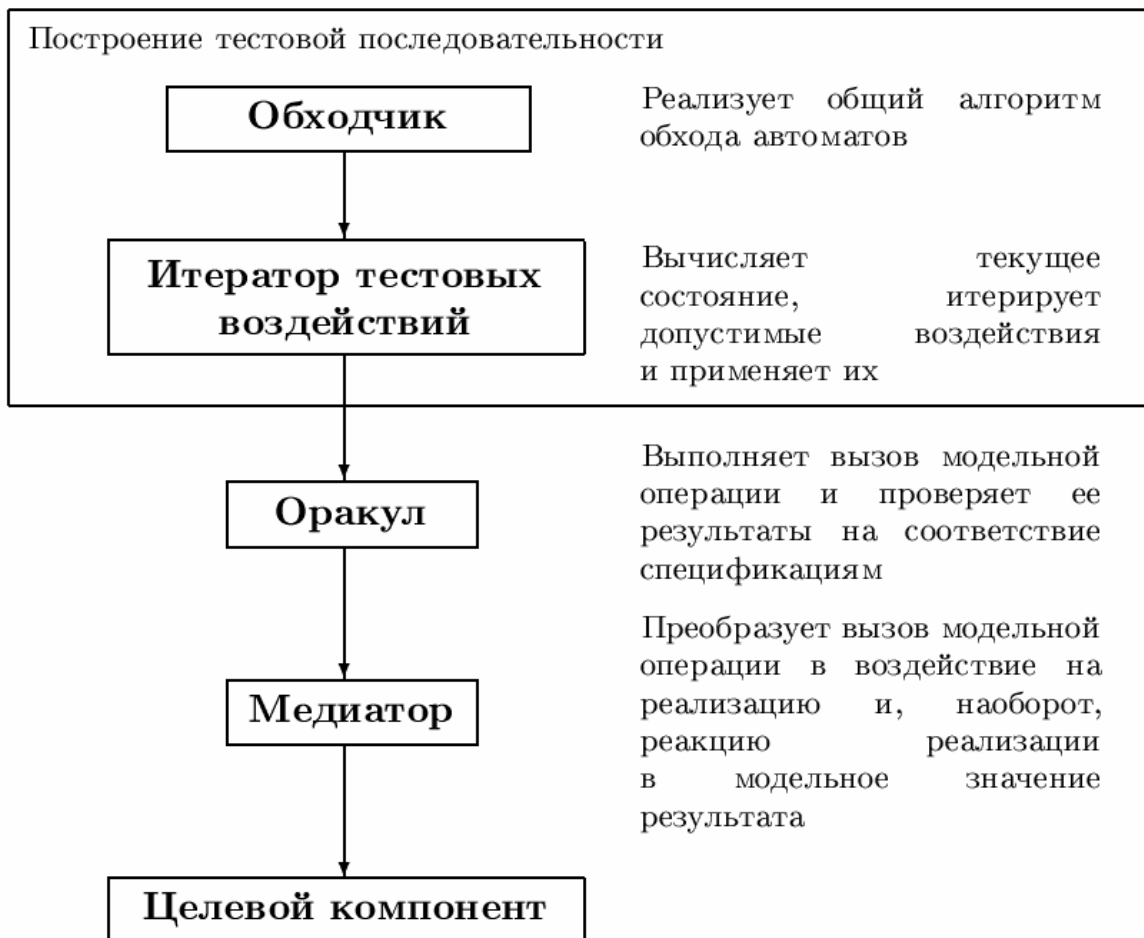
Рис. 1. Архитектура теста UniTestK.

моделируется как обращение к одной из интерфейсных операций с некоторым набором аргументов, а ответ системы на него — в виде результата этого вызова. Далее будут более детально рассмотрены специфика моделирования асинхронных реакций целевой системы и используемые техники специфицирования.