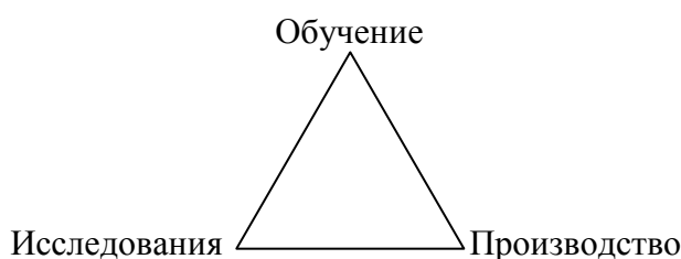
Рисунок 1. Треугольник Лаврентьева.

Так, в 40-50-х годах прошлого века, когда необходимо было ускоренными темпами восстанавливать экономику страны и одновременно развивать новые наукоемкие отрасли промышленности, ведущие советские ученые [1] сформулировали принцип подготовки специалистов высокого уровня — их полноправное участие в работе коллективов, выполняющих научные исследования и разработки для решения конкретных промышленных задач. Этот принцип был кратко сформулирован М. А. Лаврентьевым как «наука–кадры–производство» и известен под названием «треугольник Лаврентьева» [2].