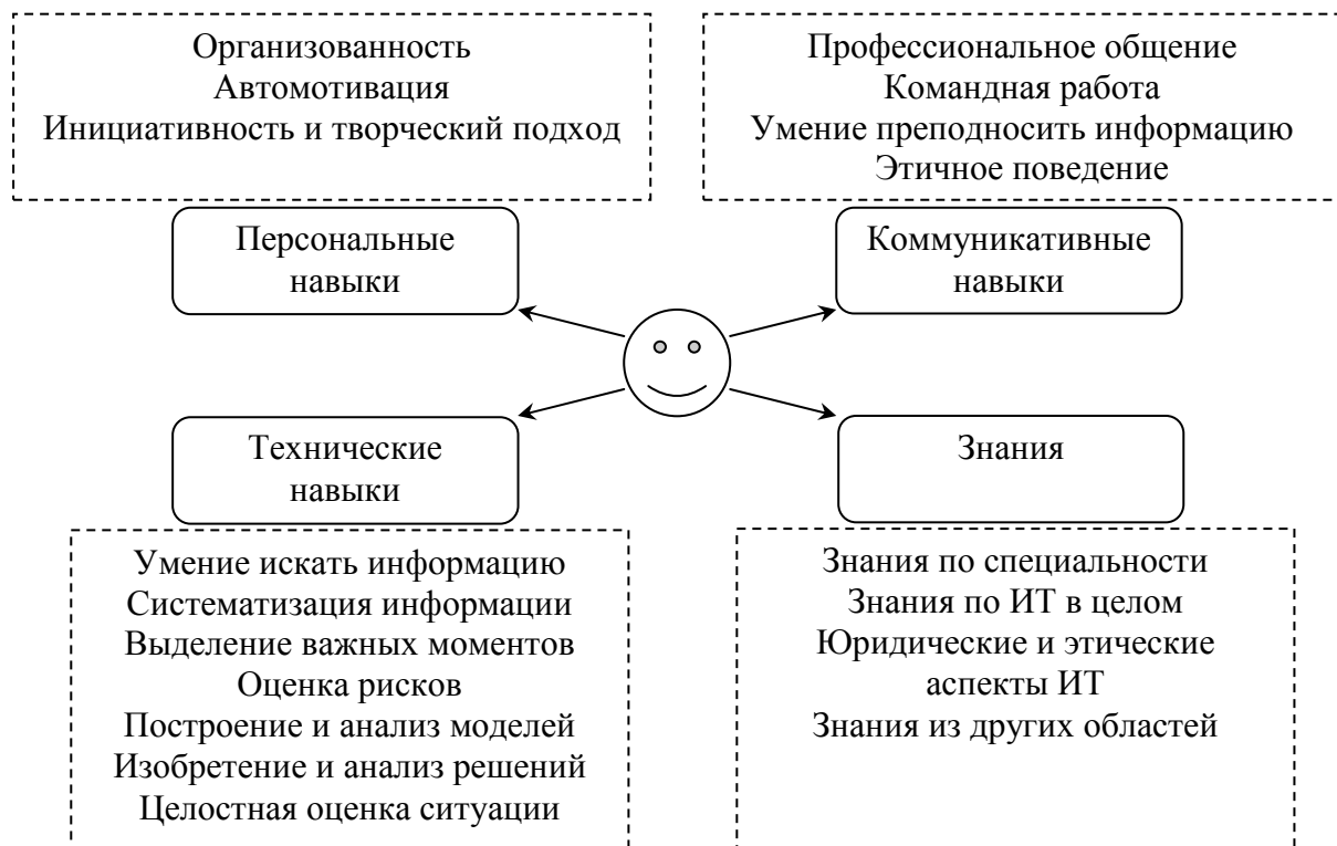
Рисунок 3. Схема знаний и навыков специалиста по ИТ.

Во время такой работы студенты получают не только знания и практические навыки работы по специальности, но и ряд навыков социального и коммуникативного характера, которые, в основном, и делают их к концу обучения грамотными специалистами, способными эффективно работать в коллективе над общей задачей. Общая схема навыков и знаний, которые необходимы современным специалистам в области ИТ, изображена на Рис. 3.